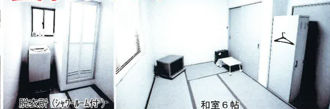
脱衣所 (シャワールーム付)