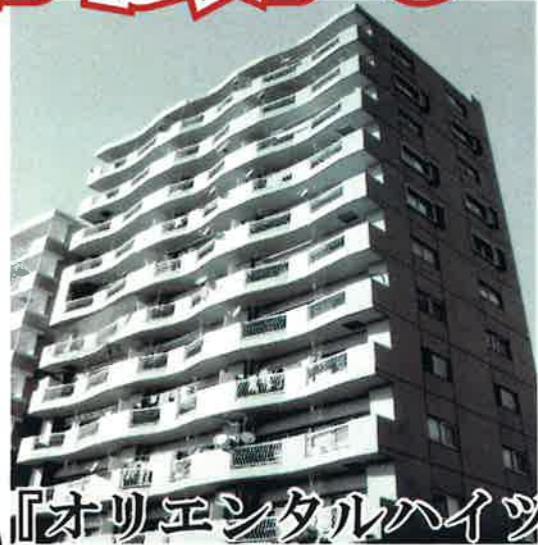
『オリエンタルハイツ』

＜ローン返済例＞ ◎月々 28,710 円 (ボーナス払いなし) 880万借入れ 30年返済 10年固定 1.1%で計算 別途：管理費、修繕積立金、駐車場代が必要となります。