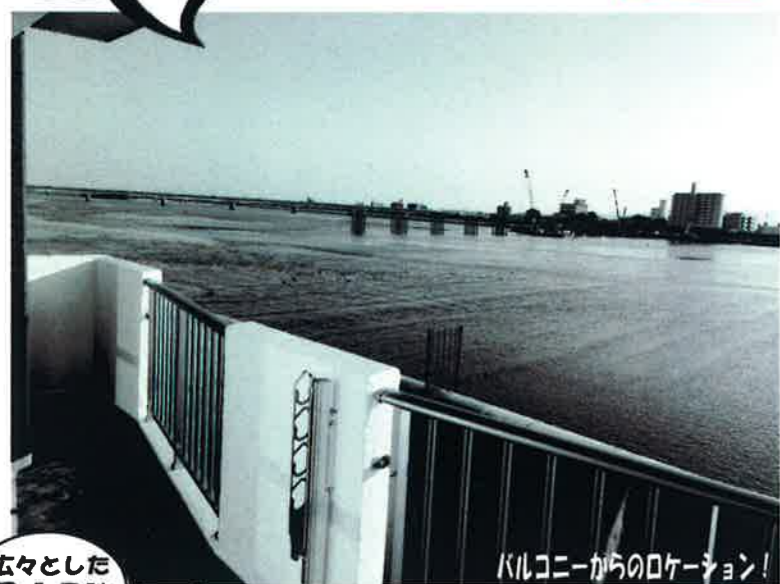
バルコニーからのロケーション！