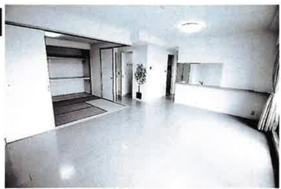
南側で明るい20.4帖のリビング