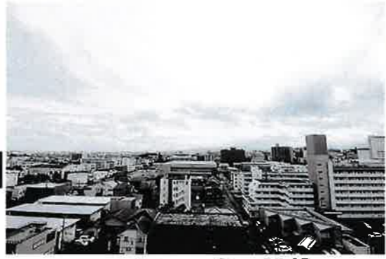
バルコニーからの眺望