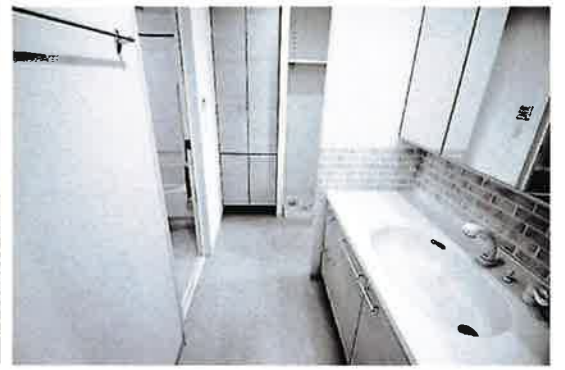
キッチンからスムーズにつながる洗面浴室