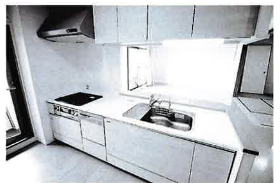
勝手口のあるキッチンスペース