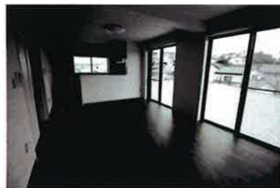
リビング 12 帖