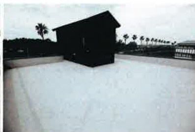
多目的につかえる屋上