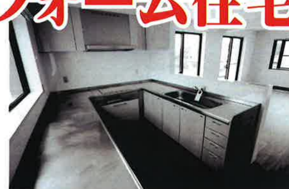
IHクッキングヒーター食洗機付きのシステムキッチン