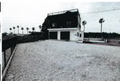
駐車に困らない敷地