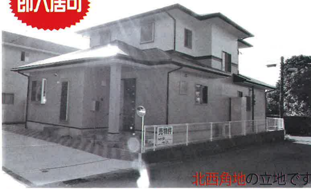
北西角地の立地です