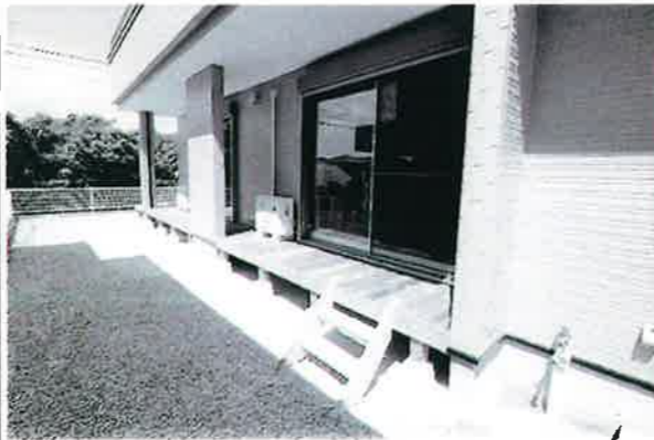
新設したウッドデッキ

所在地: 宮崎市大字本郷南方字原 2981 番地 1 構造: 木造スレート葺2階建 土地面積: 280.29㎡ (84.78坪) 床面積: 150.38㎡ (45.48坪) 都市区域: 市街化調整区域 用途地域: 無指定 建/容: 70%/200% 築年: 平成19年11月 交通: 辻原バス停 徒歩4分 学校区: 国富小学校(約750m) 本郷中学校(約1,170m) 【取引態様: 売主】